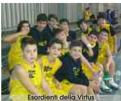
Esordienti della Virtus

Prosegue senza soste la marcia della formazione Esordienti della Virtus Trapani di basket che ha superato senza problemi con il risultato di 42 a 19 in trasferta la formazione dell' Avatar Basket 2010. Da citare la grossa prestazione di Lanza che ha realizzato la bellezza di 14 punti. Alle sue spalle le 8 lunghezze realizzate da Savalli. Per i giovani cestisti trapanesi si avvicina la prova del nove, il classico confronto nel quale dovranno dare il meglio per assicurarsi la posta in palio e di-